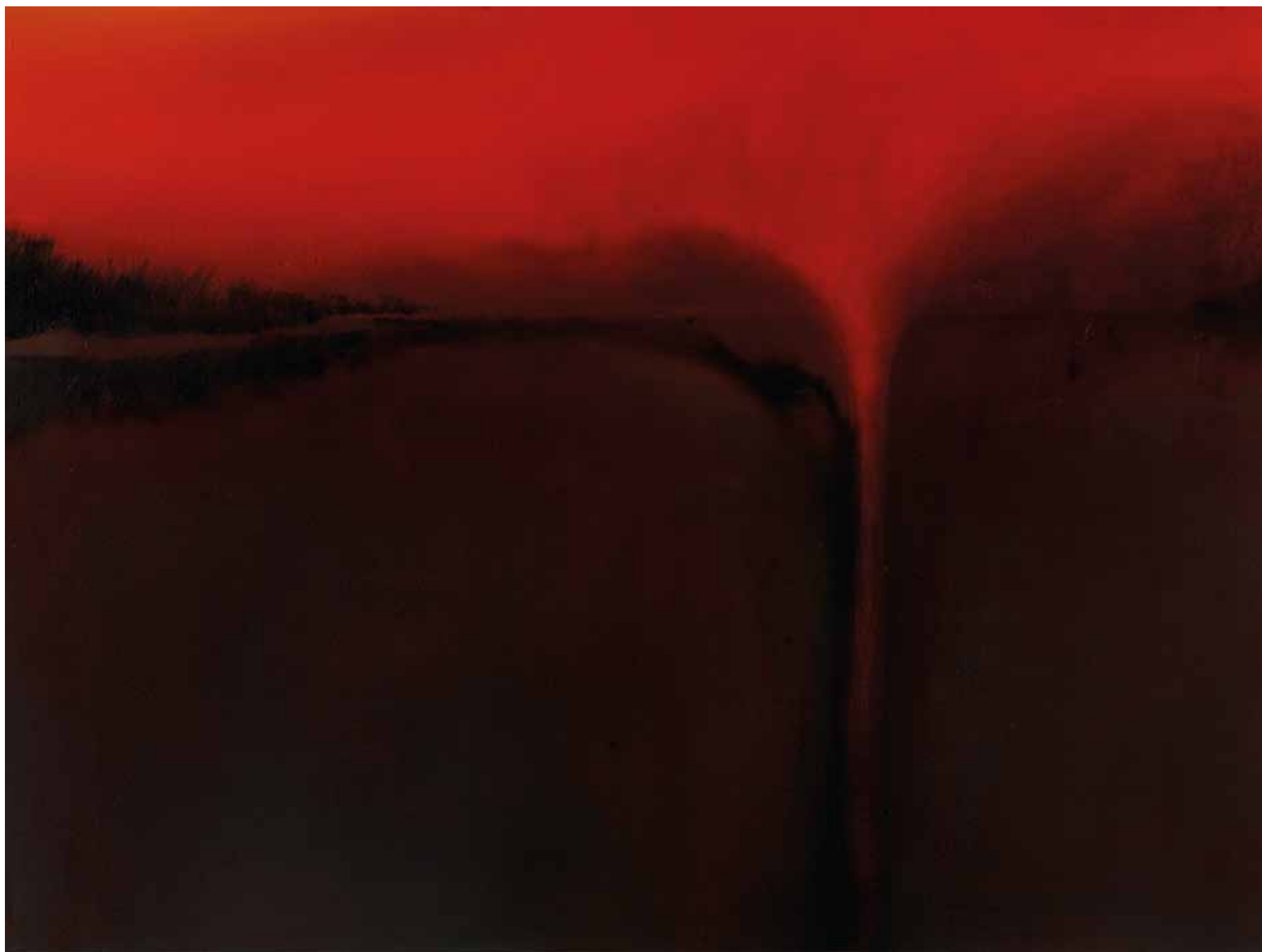
Allegro Majestuoso 2013 80 X 60 cm Oil on canvas Private collection