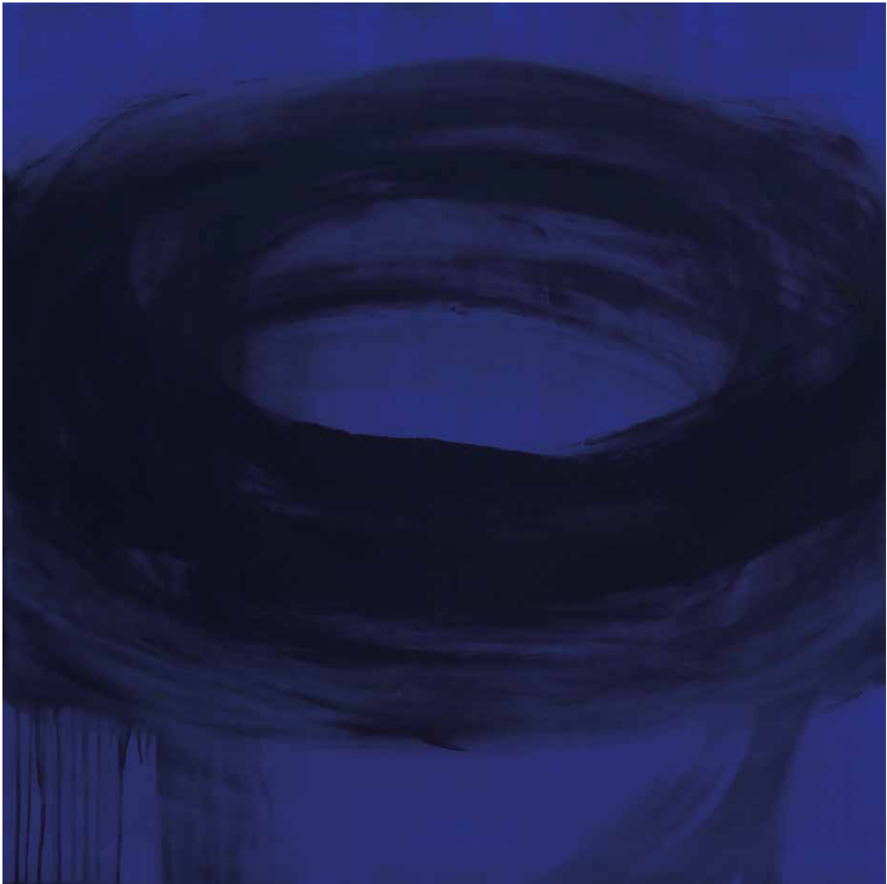
Nocturne V 2010 100 X 100 cm Oil on canvas Private collection