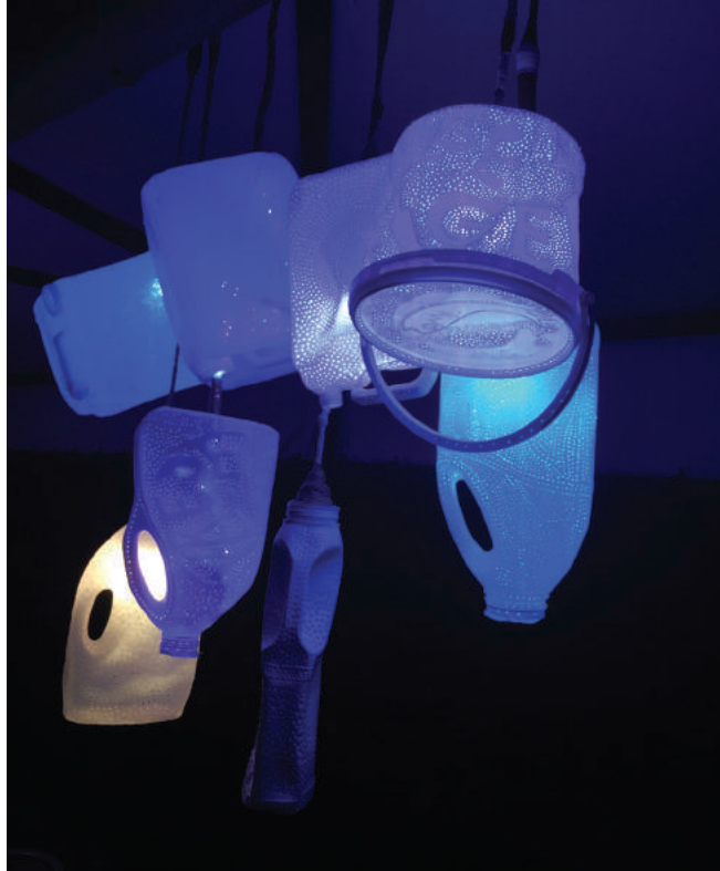
Droomluchter Simone ten Bosch gerecycled materiaal en ledlampen 800 x 70 cm