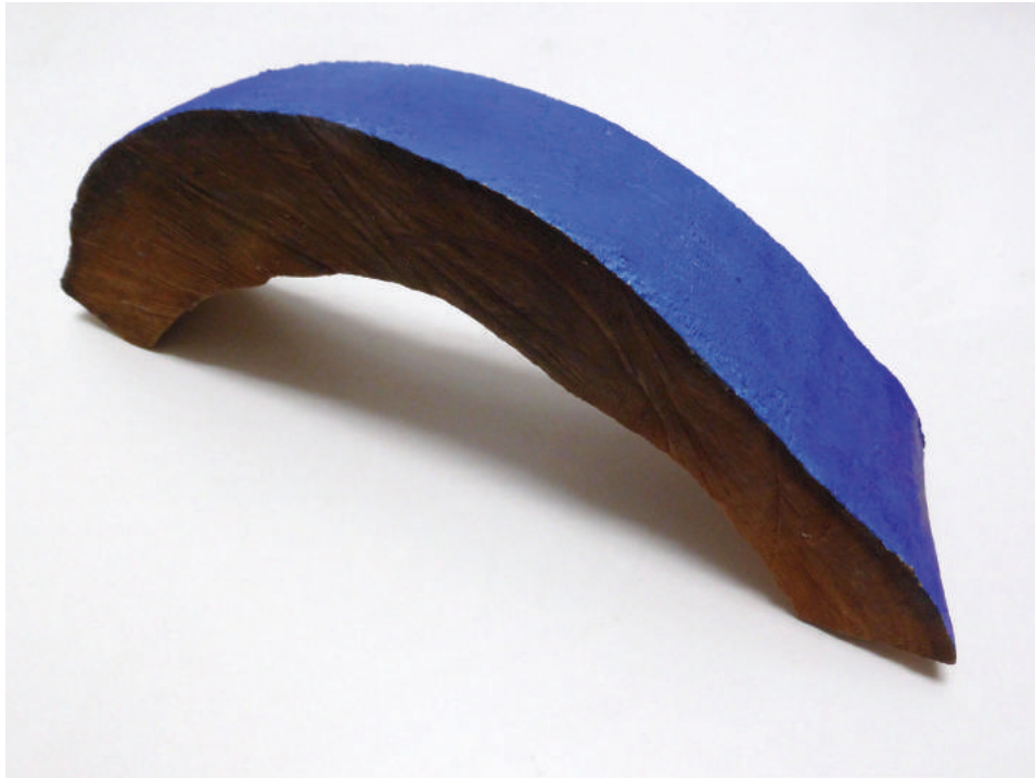
This bridge Fred Geven beschilderd hout (tamme kastanje) 16,5 x 41 x 10 cm