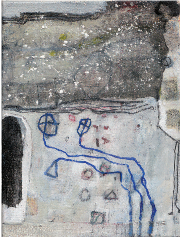
Zijlingse verwondering Jan Moerbeek olieverf op linnen 24 x 18 cm