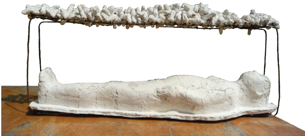
Zonder titel Els Otten papierpulp/binddraad 87 x 15 x 26 cm