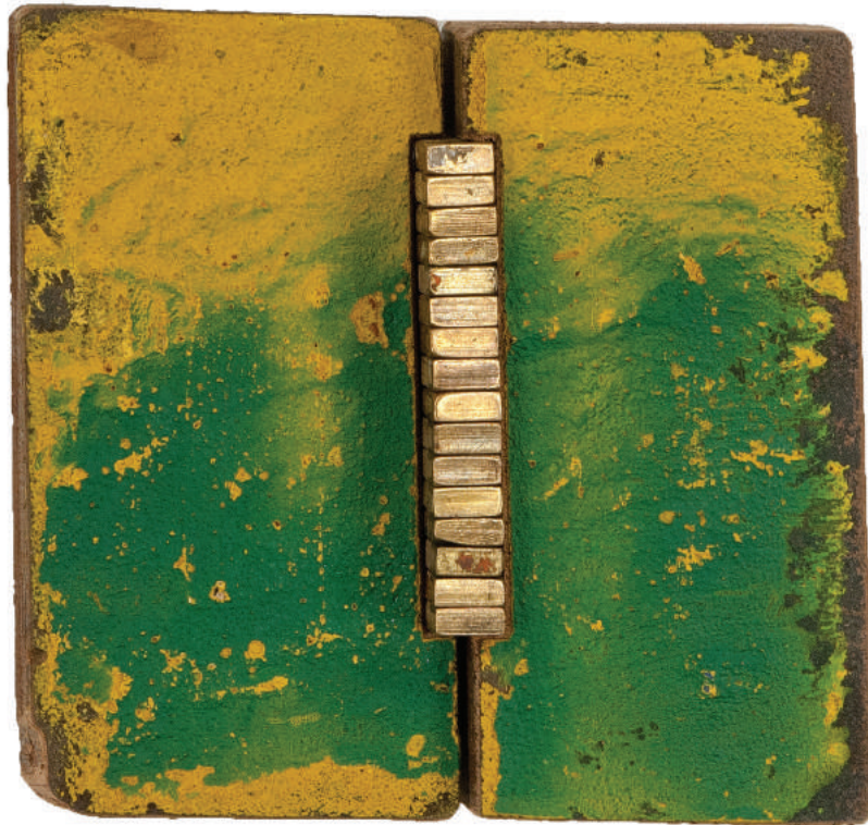
verbinding 43 Mark van den Heuvel assemblage 13 x 13,5 x 5 cm