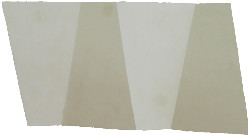
MEERLUIKEN (installatie van 5 panelen) Bertus de Veth beschilderd met krijt en gips-gronderingen Installatie op een wand van h 3 x b 6m