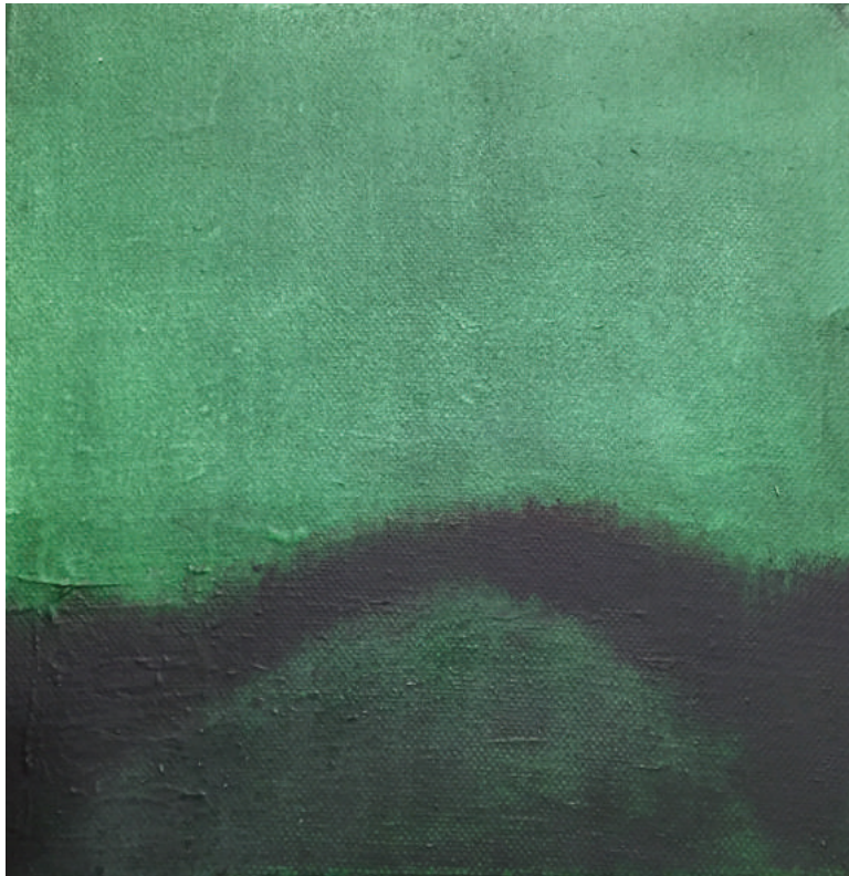
Zonder titel Paula Kouwenhoven olieverf op linnen 20 x 20 cm