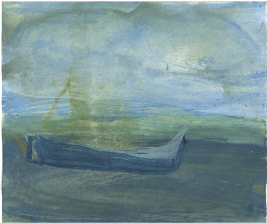
Bootje Jessica Knoot waterverf op papier 15 x 12 cm