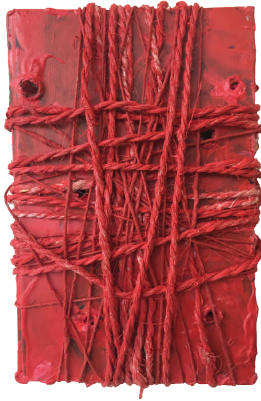
Memory II Kudo Masahide gemengde techniek 14 x 21 cm