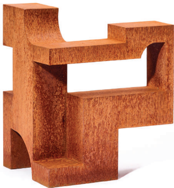
342 Helen Vergouwen cortenstaal 50,2 x 27,3 x 36,9 cm