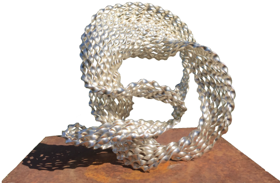
Loop Toshitaka Nishizawa koper en zilver 15 x 20 x 22 cm