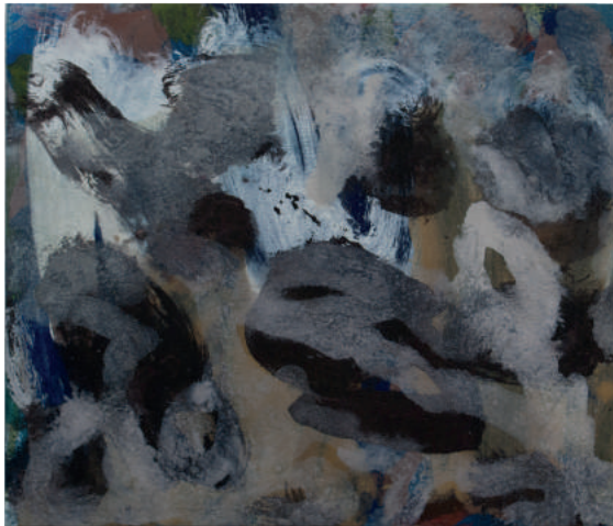
YCWM Jessica Knoot ei-tempera op paneel 30 x 35 cm 2017