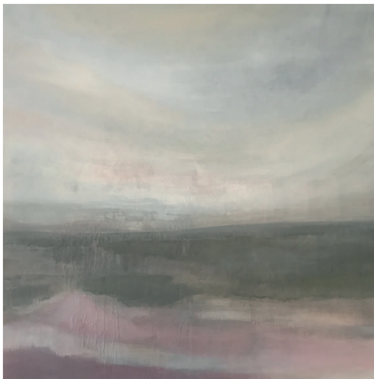
Gueliz I Paula Kouwenhoven olie/acryl op linnen 125 x 125 cm 2017