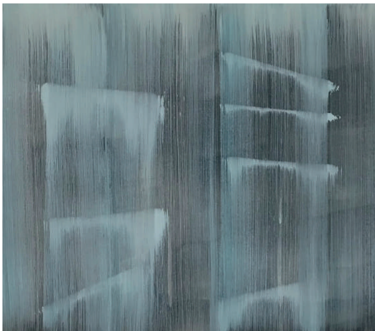
zonder titel Susan de Boer olieverf op doek 60 x 70 cm 2017