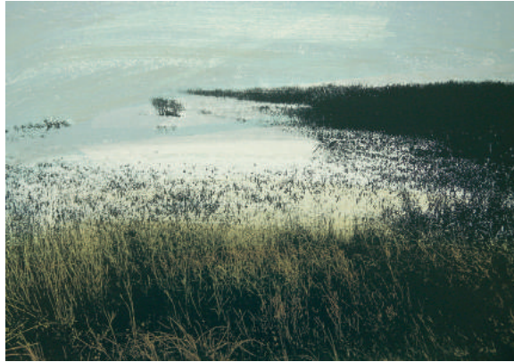
Winter op Texel Francine Steegs gemengde techniek op triplex 24 x 35 cm 2017