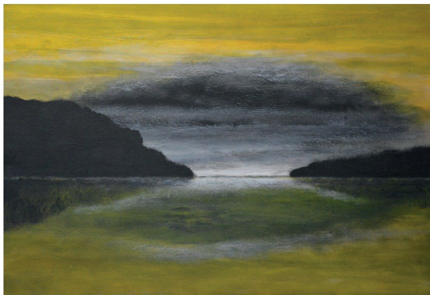
Pulau pulau Jan Radersma mixed media 4 x 60 x 80 cm 2017