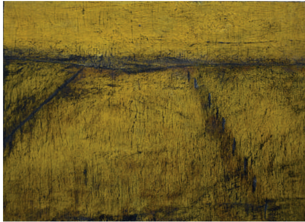
Lanskap kuning Jan Radersma mixed media 2 x 30 x 40 cm 2018