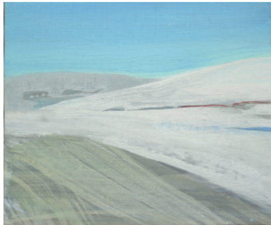
Jan Mayen-Spitsbergen José op den Berg ei-tempera op linnen 20 x 24 cm 2018