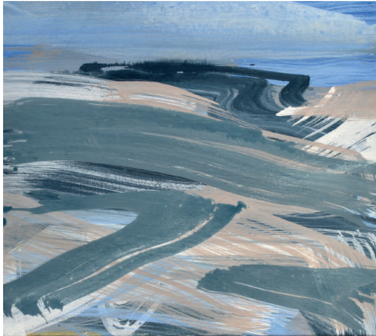
Yonder José op den Berg ei-tempera op linnen 45 x 50 cm 2017