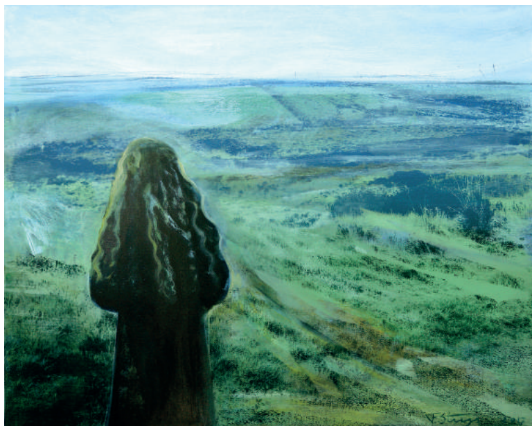
Iers uitzicht Francine Steegs gemengde techniek op doek 80 x 100 cm 2017