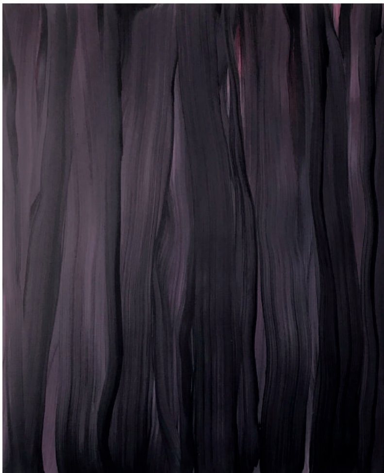
zonder titel Susan de Boer olieverf op doek 100 x 120 cm 2017